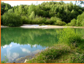
Neusorger Angel- und Badeweiher