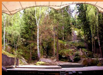
Luisenburg - Festspiele