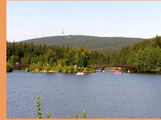
Fichtelsee i. Fichtelgebirge